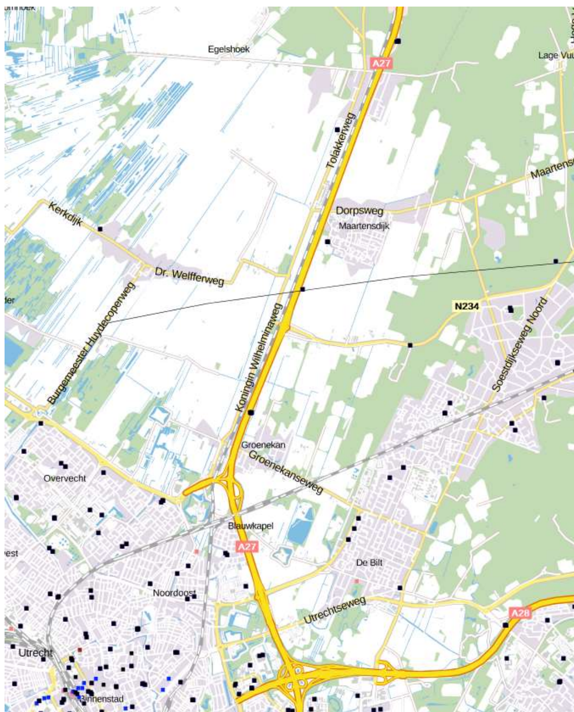
Figuur 1: Locatie huidige antenne-installaties op basis van site-sharing